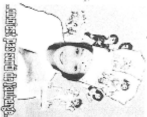
Les enfants dans...