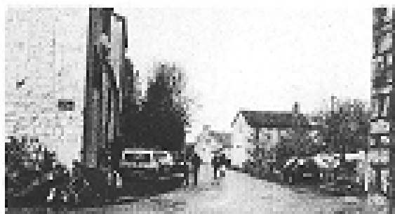
Chasse aux œufs à Escamps.